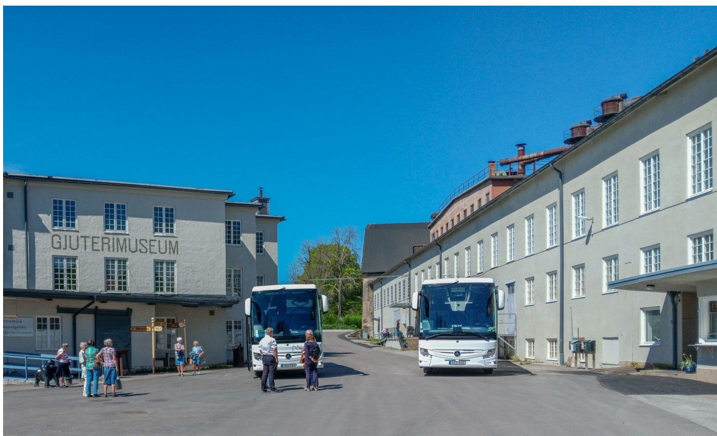
Gjuterimuséet i Hälleforsnäs var första stopp för vårens resa mot okänt mål.

redan i på mitten av 1600-talet och gav arbete åt en stor del av traktens befolkning. Gjuteriet var på sin tid var det största i norra Europa och sysselsatte omkring 1000 anställda på 1960-talet innan det gick i graven 1997. Efter rundvandring i muséet serverades en mycket god lunch i Bruksrestaurangen med jordärtskockssoppa, Wallenbergare samt kaffe och kaka.