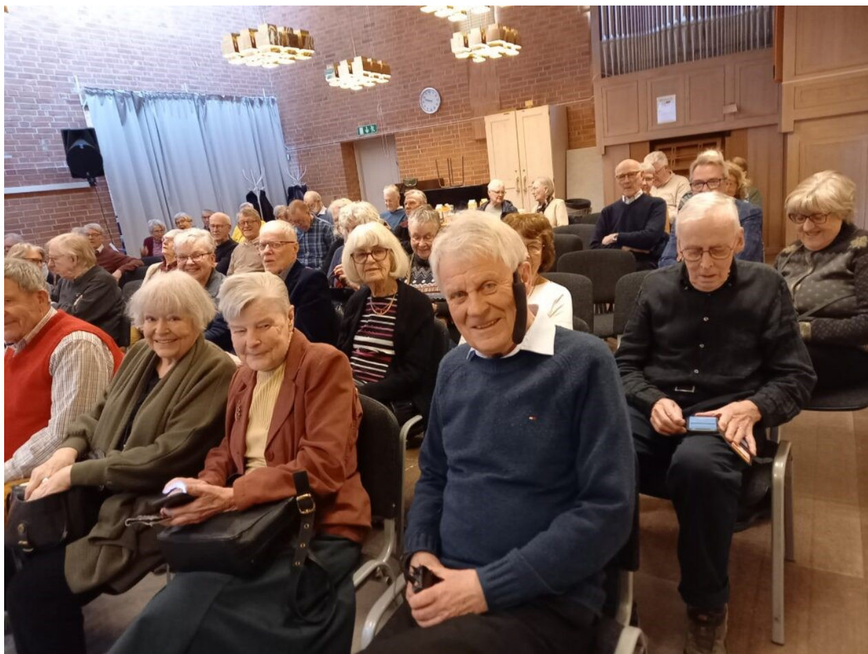
Många av ESU:s medlemmar har deltagit i föreläsningsserien "Krishärddar i världen" med Stig Wahlström som föreläsare. Text och foto: Anita Norberg