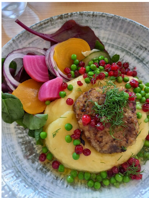
Resans kulinariska höjdpunkt var lunchen på Bruksrestaurangen i Hälleforsnäs, där det serverades Wallenbergare med potatismos och övriga tillbehör som hör till.

Därefter fortsatte resan till nästa stopp som visade sig vara Fogelstad i Julita där Kvinnliga Medborgarskolan verkade under åren 1925-1954. Här väntade en guidad rundvandring i skolbyggnaden och i gamla mejeriet, där en inressant utställning gjorts i ordning. Här fick deltagarna en fullödlig information om den verksamhet som här bedrevs av några av landets mest färgstarka och namnkunniga kvinnor. Medborgarskolan startades av ägaren till Fogelstads säteri Elisabeth Tamm i samarbete med riksdagsledamoten Kerstin Hesselgren, pedagogen och rektorn Honorine Hermelin, läkaren Ada Nilsson och författaren Elin Wägner. Till Fogelstad kom kvinnor i olika åldrar och från alla samhällsklasser för att genom föreläsningar, diskussioner och erfarenhetsutbyte få kunskaper för att kunna delta i framtidens samhällsarbete. Handens, hjärnans och hjärtats arbete stod i centrum för pedagogiken och under 30 års tid utbildades inte mindre än 2000 kvinnor på Fogelstad. I dag drivs verksamheten av kulturföreningen Fogelstad och syftet är att synliggöra svensk kvinnohistoria genom kurser, föreläsningar, skrivarhelger m m. Ett mycket intressant mål för resan, tyckte besökarna innan de klev ombord på bussarna för återfärd till Eskilstuna efter en mycket givande dag.