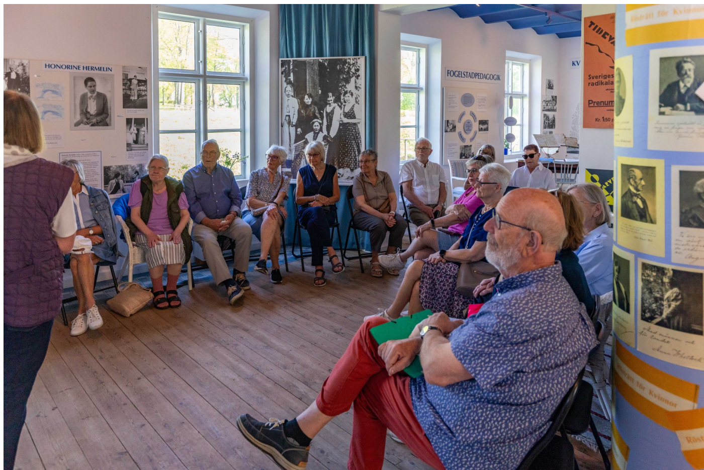
Intresserade deltagare fick lyssna till uppkomsten av Kvinnliga Medborgarskolan och den verksamhet som bedrevs för kvinnor i alla åldrar och samhällsklasser.