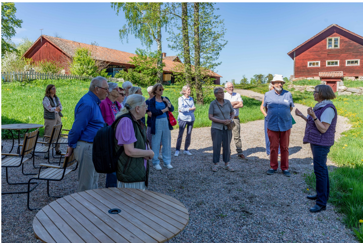
Ett mycket intressant och givande stopp gjordes vid Fogelstad där Kvinnliga medborgarskolan bedrev verksamhet åren 1925-1954.